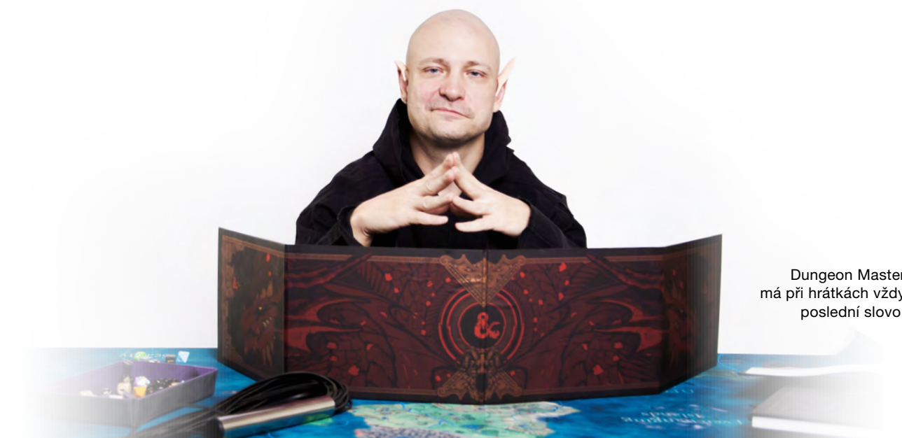
Dungeon Master má při hrátkách vždy poslední slovo.

Naopak pokud si na atrakci chce hrát někdo nezkušený, a neví například, jak by na ni měl partnera ukotvit, může se na ně obrátit a rádi mu poradí/pomohou. Občas také řeší situace, kdy někdo (často posilněn alkoholem) neví, kde jsou rozumné meze a zapomíná na SSC pravidla. Takovýto člověk je taktně upozorněn na své nevhodné chování. V ideálním případě si svou chybu uvědomí, omluví se a buď oblast opustí, nebo si začne držet dostatečný odstup. Pokud varování nezabere, může očekávat, že Dungeon Master zavolá naše sekuriťáky, kteří ho z akce obratem vyprovodí. V podobné situaci je dobré připomenout, že pokud vás (nebo někoho jiného) někdo obtěžuje a Dungeon Master to nepostřehne, nebojte se ho na situaci upozornit. Pokud by nebyl zrovna poblíž, nebojte se upozornit kohokoli z naší crew – obvykle je poznáte podle triček s nápisem Hell Events Crew – a řešení je nasnadě. Jsme tu pro vás a podobné informace oceníme a obratem situaci vyřešíme.